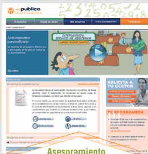
Asesoramiento Modelos de informe Simuladores Guías didácticas Servicio de Asistencia Personalizado

Además con el SERVICIO DE ASISTENCIA , el usuario podrá acceder a guías didácticas para la realización de cualquier informe y contar con el apoyo de un gestor que le resuelva dudas, aclare cuestiones concretas, supervise sus informes o se encargue de su ejecución.