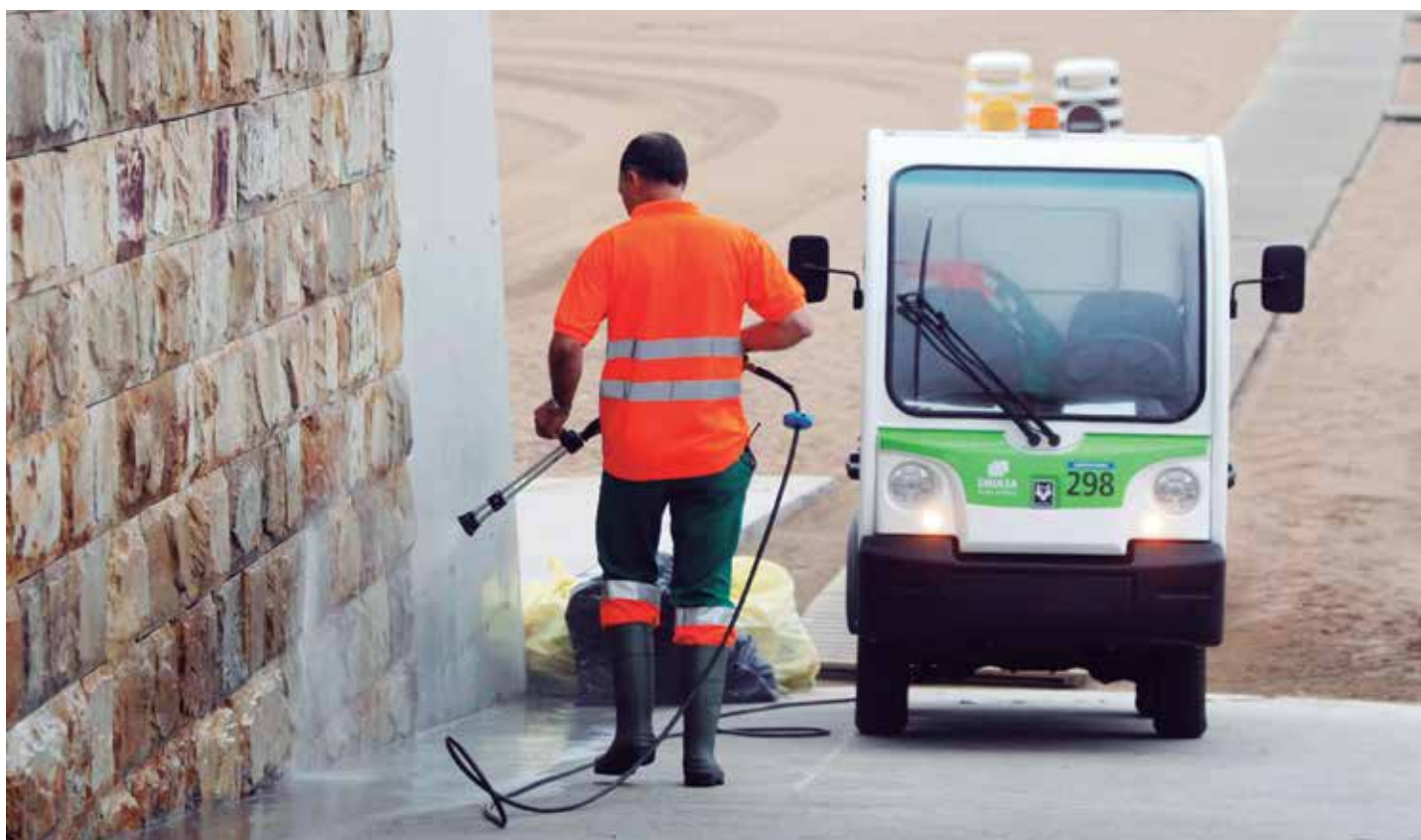
Sobre la asunción de servicios municipales por parte de las Diputaciones, la FEMP pide limitarlo en el tiempo y recuerda que lo que se asume es el servicio, nunca la competencia, que siempre correspondería al municipio.

Asimismo, reclama que se suprima la necesidad de un informe previo de la Administración General del Estado para el nombramiento y cese de los interventores que ocupen puestos de trabajo provistos por el sistema de libre designación –un sistema que sólo pueden utilizar los municipios de gran población–.