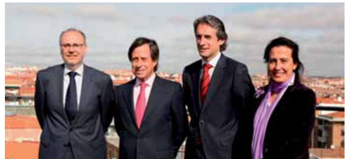
El Alcalde de Alcobendas (segundo por la izquierda) fue el anfitrión de la reunión del Comité Técnico, el 10 de abril.

Además de las ciudades incorporadas en la reunión de Castellón, forman parte de la Red Alcobendas, Alicante, Barcelona, Burgos, Cáceres, Castellón, Córdoba, Guadalajara, A Coruña, Elche, Gijón, Logroño, Lugo, Huesca, Madrid, Málaga, Marbella, Murcia, Palencia, Pamplona, Rivas-Vaciamadrid, Salamanca, Santander, Segovia, Valencia, Valladolid, Vitoria-Gasteiz, Sabadell y Zaragoza. ★