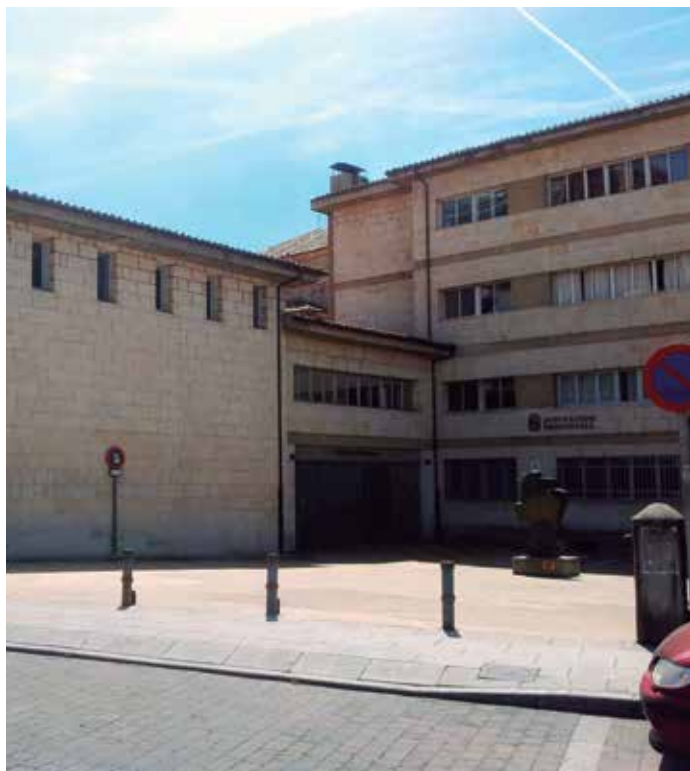
Centro Asociado de Zamora.