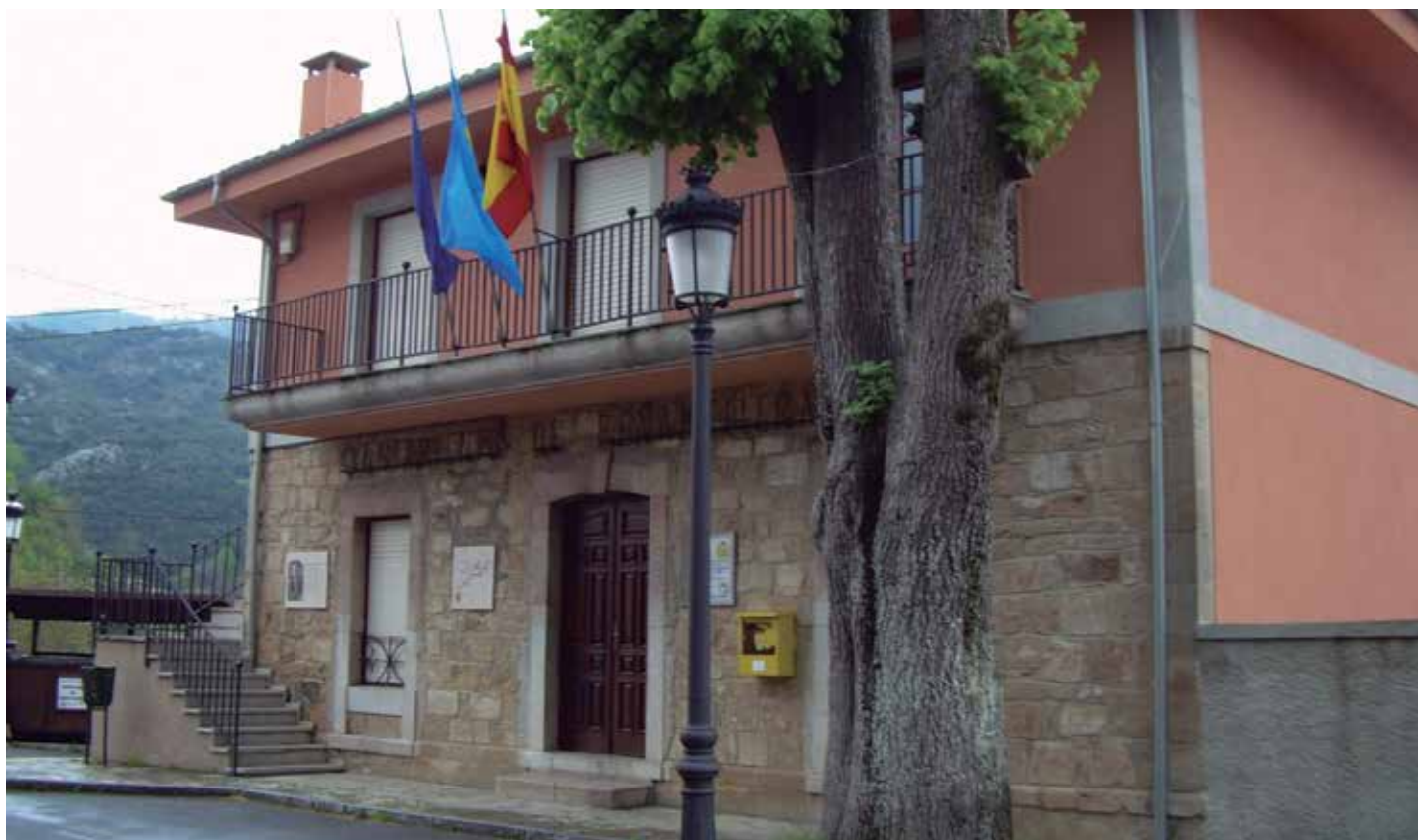
En sus alegaciones, la FEMP propone la supresión del régimen especial de intervención de municipios con menos de 5.000 habitantes con un plan económico financiero en vigor. En la foto, el Ayuntamiento de Peñamellera Alta (Asturias).

El pasado 9 de abril, tras la reunión de su Junta de Gobierno, la FEMP hizo llegar al Ministerio de Hacienda y Administraciones Públicas el documento con las alegaciones planteadas al texto sobre reforma local. La remisión de este documento abre ahora una nueva etapa en la trayectoria de la reforma que incluirá la convocatoria de una CNAL específica, el paso del futuro redactado por el Consejo de Estado y el arranque de su tramitación parlamentaria.