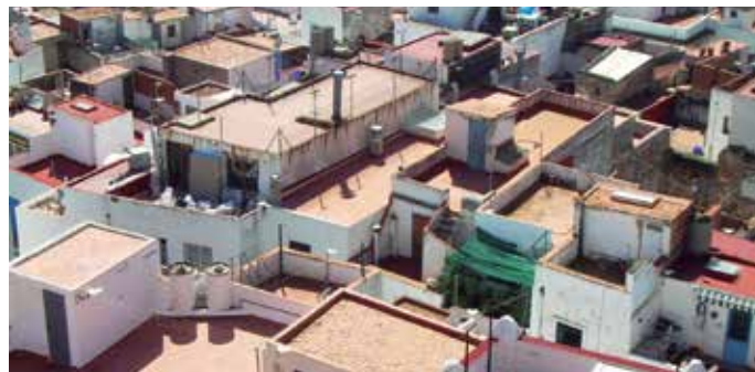
La rehabilitación y la regeneración urbana pretende ser un instrumento de reactivación del sector de la construcción.

Unos datos que hablan por sí solos de la necesidad de potenciar la actividad de rehabilitación de nuestras casas y edificios y de las posibilidades que ofrece esta actividad para la reactivación de sectores importantes de nuestra economía productiva.