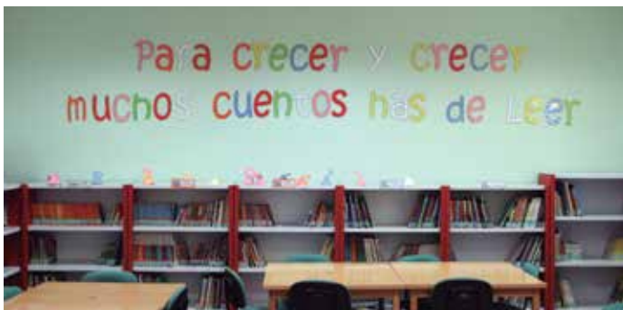
Biblioteca de Mota del Cuervo.