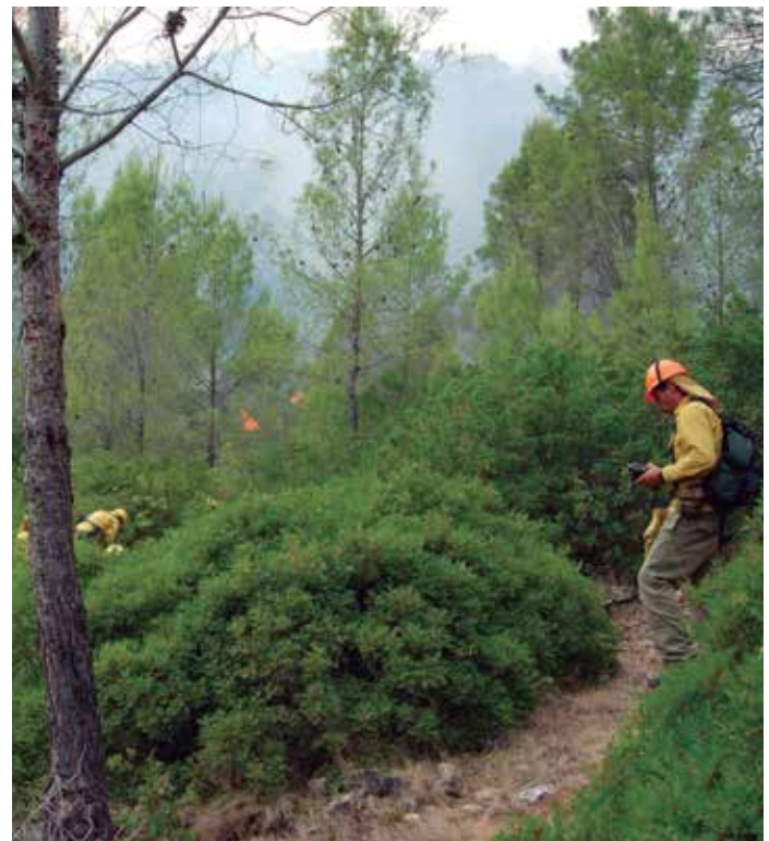
Las labores de limpieza y de regeneración de las zonas afectadas por los incendios contarán con financiación del Ministerio de Agricultura, Alimentación y Medio Ambiente.

De estos incendios, el de Guadalajara afectó a 1.182 hectáreas, de las cuales 824 eran arboladas, mientras que el de Hellín, en Albacete, y Moratalla, en Murcia, arrasó 6.820 hectáreas, de las que 5.719 hectáreas eran arboladas.