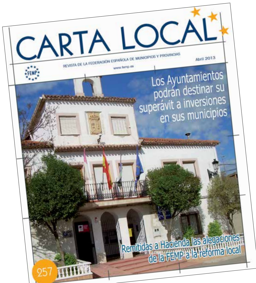
Foto de portada: Ayuntamiento de Santa María del Campo Rus (Cuenca)

Deposito Legal: M-2585. 1990 Carta Local no comparte necesariamente las opiniones vertidas por su colaboradores. Carta Local autoriza la reproducción de sus contenidos, citando su procedencia.