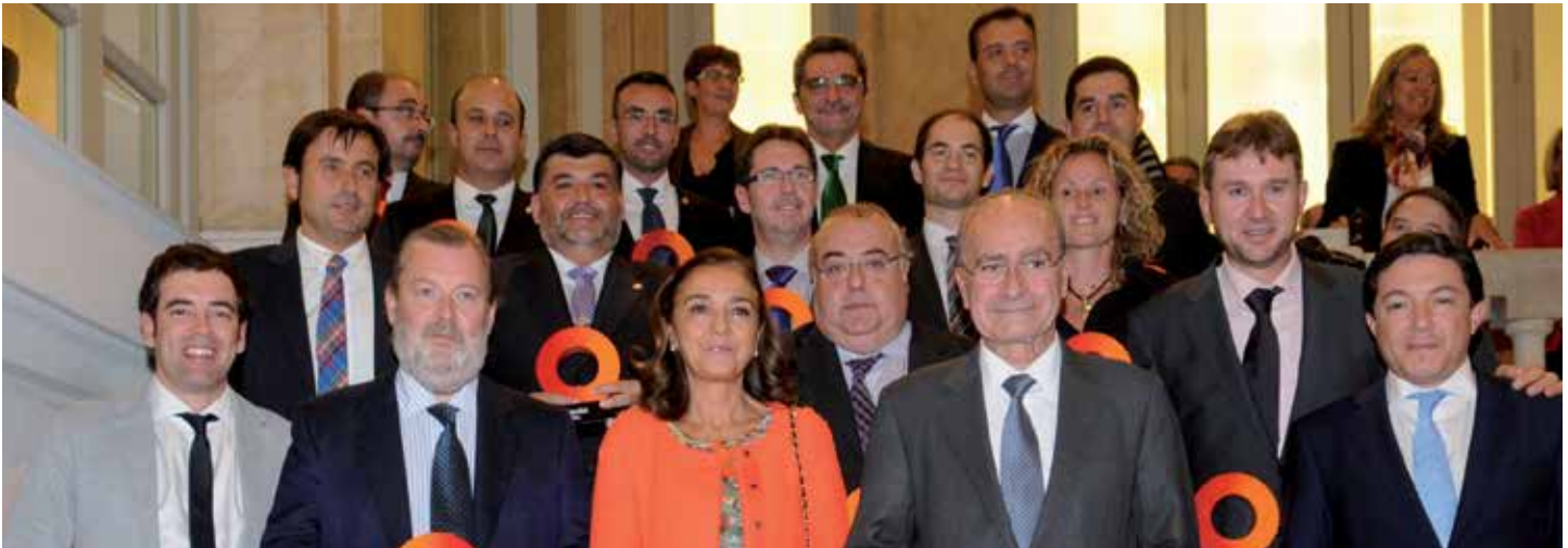
Los Alcaldes premiados en la última edición, junto a la Secretaría de Estado, en octubre de 2012.