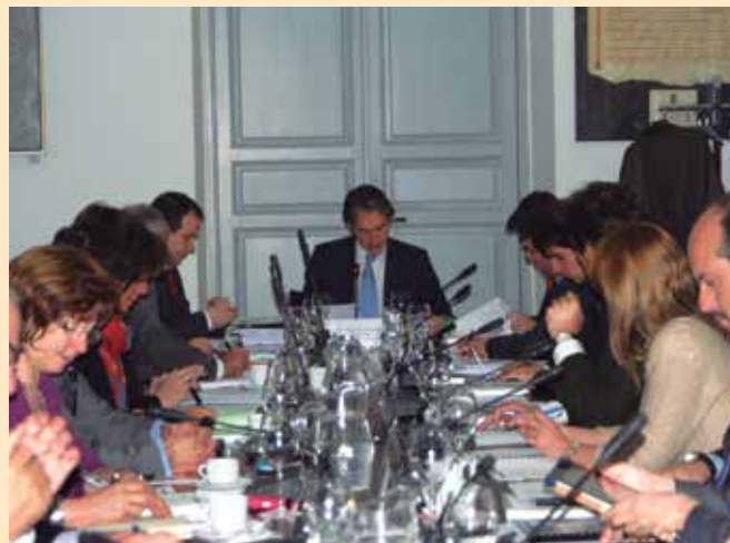
La FEMP también pide que sea la propia Entidad Local y no el interventor quien remita al Tribunal de Cuentas un informe anual con los acuerdos contrarios a los reparos formulados por el interventor, adoptados por el Presidente de la Entidad y el Pleno.