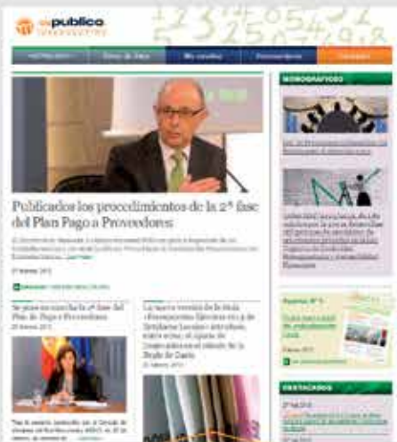
Actualidad Todas las noticias actuales Monográficos, apuntes, destacados...

Todo lo que necesitas para responder a los nuevos requerimientos con facilidad y solvencia