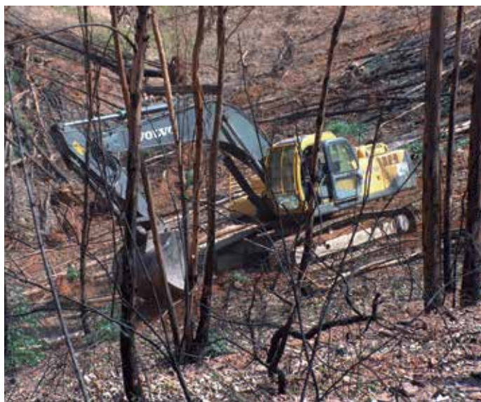
Con las subvenciones se emprenderán obras de restauración forestal.

En la Región de Murcia se llevará a cabo una inversión de 728.651 euros para la restauración forestal y medioambiental del territorio afectado por el incendio que se declaró el pasado 1 de julio en el término municipal de Moratalla. Entre los incendios del pasado verano destacan el de Hellín (Albacete) y Moratalla (Murcia) que arrasó 6.820 hectáreas, de las cuales 5.719 eran arboladas.