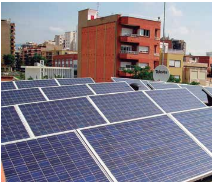
La eficiencia energética de los edificios es uno de los objetivos de las medidas aprobadas

Estos datos, junto con la necesidad de facilitar el acceso a la vivienda a los sectores de población con menores recursos y la posibilidad de reactivación del sector de la construcción con la rehabilitación de edificios y la regeneración y renovación urbanas, son los que han llevado al Gobierno a la aprobación de una nueva Ley que facilite el arrendamiento de viviendas, con criterios de eficiencia energética y calidad, y que también impulse la remodelación de los tejidos urbanos o la reurbanización de amplias zonas dentro de las ciudades.