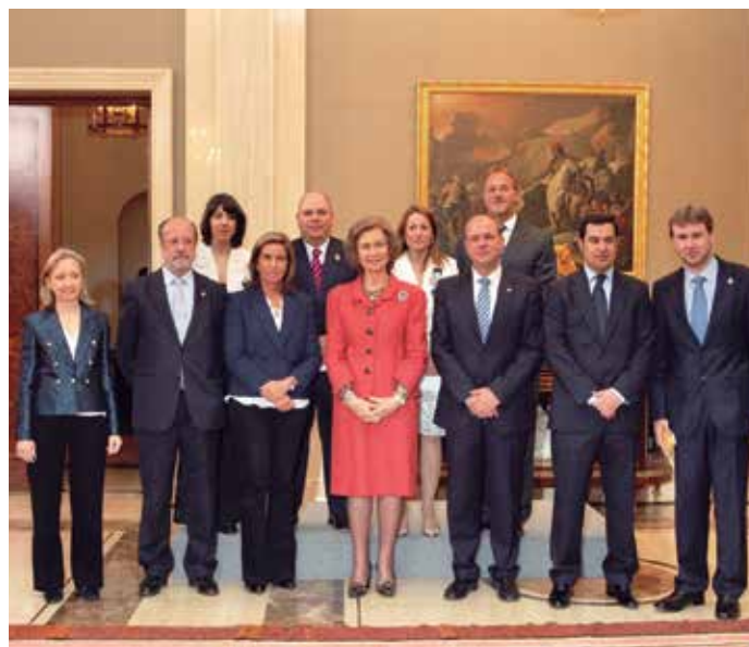
Doña Sofía posa con los galardonados y con la Ministra de Sanidad, Servicios Sociales e Igualdad, el Secretario de Estado de Servicios Sociales e Igualdad y Secretario General del Real Patronato sobre Discapacidad.

El Real Patronato sobre Discapacidad es un organismo autónomo adscrito al Ministerio de Sanidad, Servicios Sociales e Igualdad, cuya presidencia de honor desempeña Su Majestad la Reina. Entre sus fines figura la promoción de la prevención de deficiencias, la rehabilitación y la inserción social de las personas con discapacidad; facilitar, en esos ámbitos, el intercambio y la colaboración entre las distintas Administraciones Públicas, así como entre éstas y el sector privado, tanto en el plano nacional como en el internacional. ★