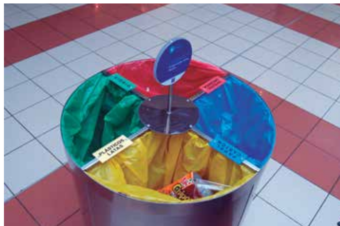
España, con una tasa de reciclado del 33%, se sitúa todavía por debajo de la media europea, fijada en el 35%.