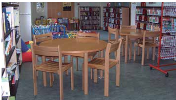
Biblioteca de Iurreta.

Las bibliotecas municipales de Iurreta (Vizcaya), Mota del Cuervo (Cuenca) y San Javier (Murcia) han sido las ganadoras de la XV Campaña de Animación a la Lectura María Moliner, convocada por el Ministerio de Educación, Cultura y Deporte, la FEMP y la Fundación Coca-Cola Juan Manuel Sainz de Vicuña. El fallo ha sido hecho público recientemente por la comisión de valoración de estos premios que se conceden cada año.