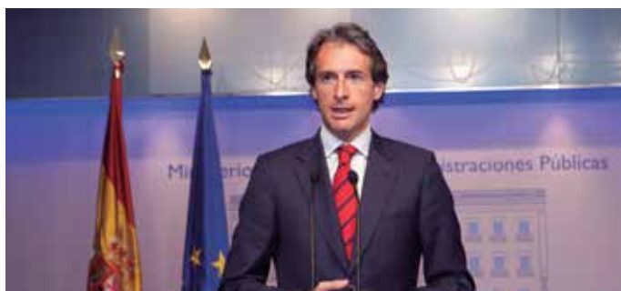
El Presidente de la FEMP compareció al finalizar la Comisión.

En segundo, el que estudiará las medidas a adoptar tras la sentencia emitida por el Tribunal Superior de Justicia de Castilla-La Mancha en rela-