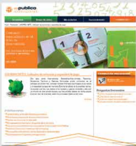
Formación Cursos a distancia