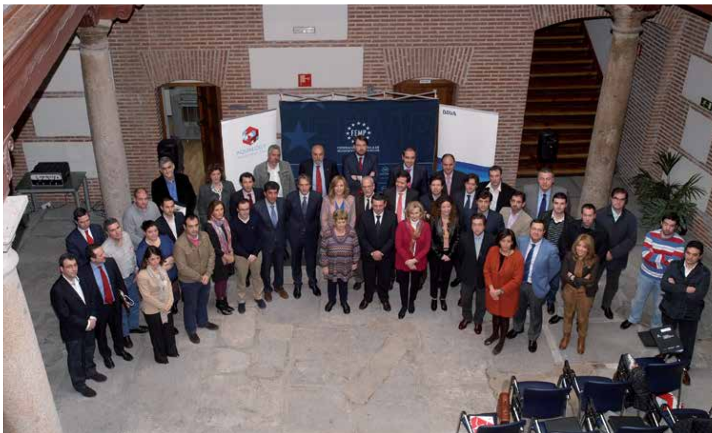
Organizadores, patrocinadores y participantes en el programa, posan tras el acto de presentación celebrado en la sede de la FEMP el pasado febrero.

Los ejercicios prácticos en sets de televisión y radio o las técnicas de voz, junto con las recomendaciones a cada alumno sobre sus intervenciones, realizados en la segunda jornada, completaron este curso. ★