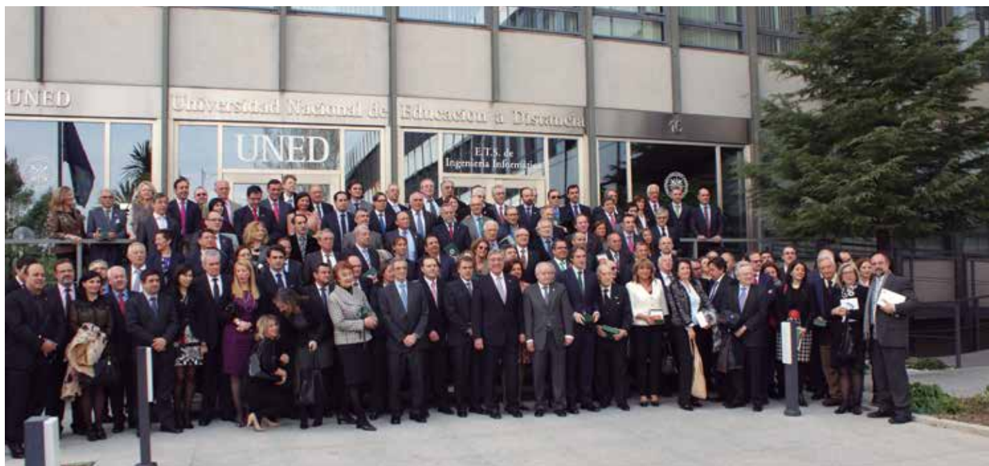
Los responsables de los centros de toda España posaron con las autoridades al finalizar el acto.

Es muy loable el intento de clarificar las competencias entre las distintas Administraciones. Pero, como me dicen muchos Alcaldes, que nadie discuta que el apoyo a los centros de la UNED es una competencia propia de las Administraciones Locales. Porque se lo han ganado a lo largo de estos cuarenta años. Porque, en otro caso, me dicen "¿qué otra Administración va a garantizar el apoyo a que el Centro de la UNED siga aportando su impagable labor en mi ciudad?" ★