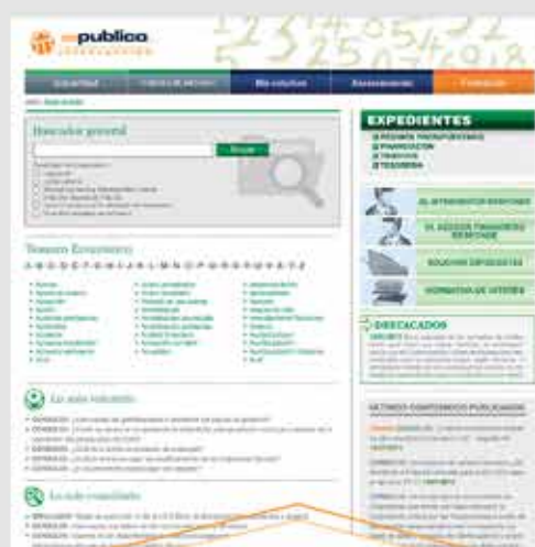
Bases de datos Expedientes, legislación, jurisprudencia... Servicio de Consultas y Expedientes Tesoro económico, últimos contenidos