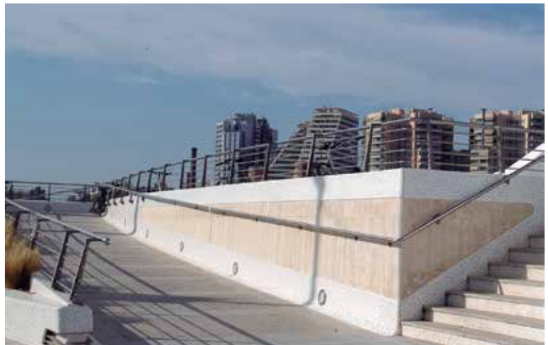
Las ciudades no deben ser hostiles para los ciudadanos con discapacidad.

La petición la ha formulado mediante un comunicado en el que destacan que estos proyectos deben servir también para "fomentar que las ciudades del futuro, además de contemplar la tecnología como mecanismo base para explorar todo un mundo de facilidades para el ciudadano, no deben ser hostiles hacia el colectivo de las personas con discapacidad" .