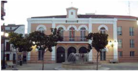
Ayuntamiento de Navalmoral de la Mata (Cáceres).

La Junta de Extremadura está elaborando una herramienta telemática destinada a que la correspondencia postal y el soporte papel desaparezca en las relaciones entre los Ayuntamientos y la Administración Regional. La aplicación permitirá la generación, autorrelleno y archivo de formularios, el registro de la documentación, la creación automática de bases de datos, entre otras prestaciones.