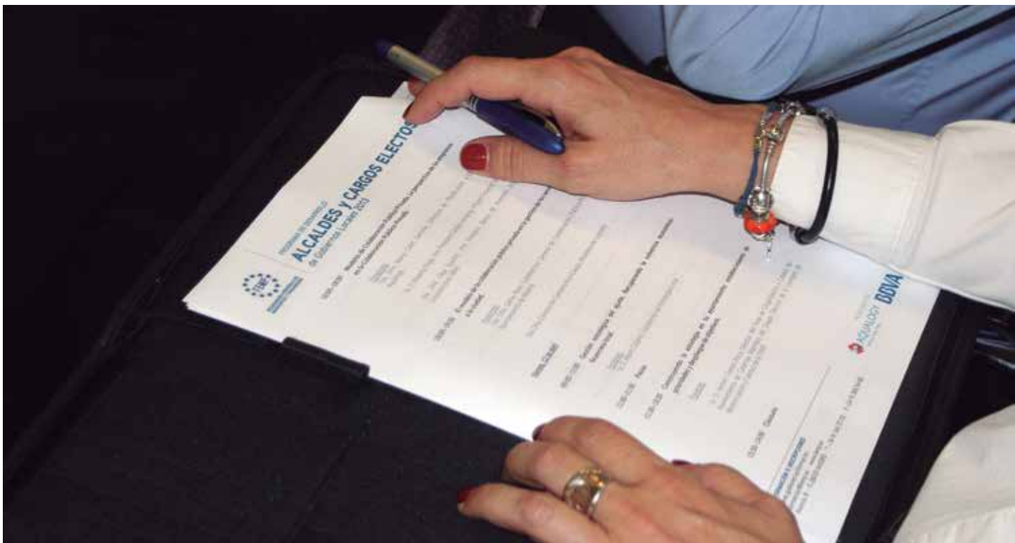
Los dos últimos cursos han sumado ochenta participantes.

Comunicación institucional y personal eficaz y retos actuales del municipalismo son los temas que centraron los dos últimos cursos realizados en el marco del Programa de Desarrollo de la FEMP dirigido a Alcaldes y electos locales y realizado con el patrocinio de Aqualogy y BBVA. 60 participantes en el curso sobre retos del municipalismo y 20 en el de comunicación (un aforo limitado por las características del curso), resumen en cifras el avance de un programa que, cuando finalice, el próximo junio, habrá dado formación a casi 400 responsables locales.