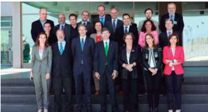
Los Alcaldes participantes en la reunión de Castellón.

Doce nuevos municipios se han incorporado a la Red Española de Ciudades Inteligentes (RECI), cuya admisión se aprobó en su última Junta Directiva celebrada en Castellón el 17 de abril, con lo que su número de integrantes se eleva ya a 41. Alcorcón, Aranjuez, Móstoles y Torrejón de Ardoz (Madrid), Ávila, Badajoz, Oviedo (Asturias), Palma de Mallorca, Ponferrada (León), Sevilla, Tarragona y Torrent (Valencia) son las nuevas incorporaciones.