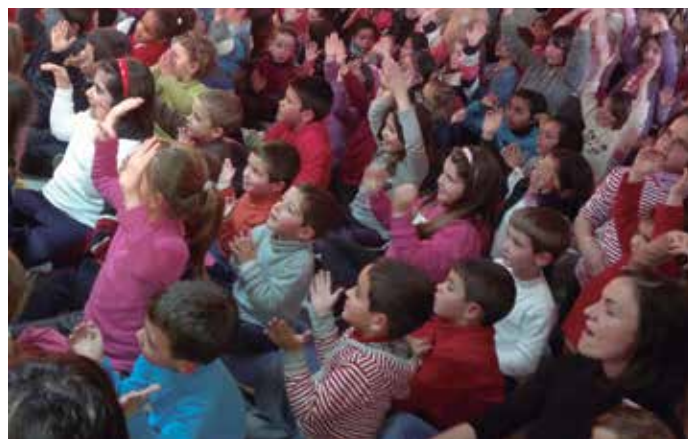
Actividad de cuentacuentos en la Biblioteca de San Javier.

El jurado ha valorado, entre otras cuestiones, la continuidad de este proyecto, las herramientas de publicidad y de seguimiento que utilizan, y también el hecho de que colaboran con centros educativos, asociaciones, el centro de salud, hogar del jubilado y otros servicios municipales, además de su vinculación a la Red de Bibliotecas y el servicio de bibliotecas del Gobierno Vasco.