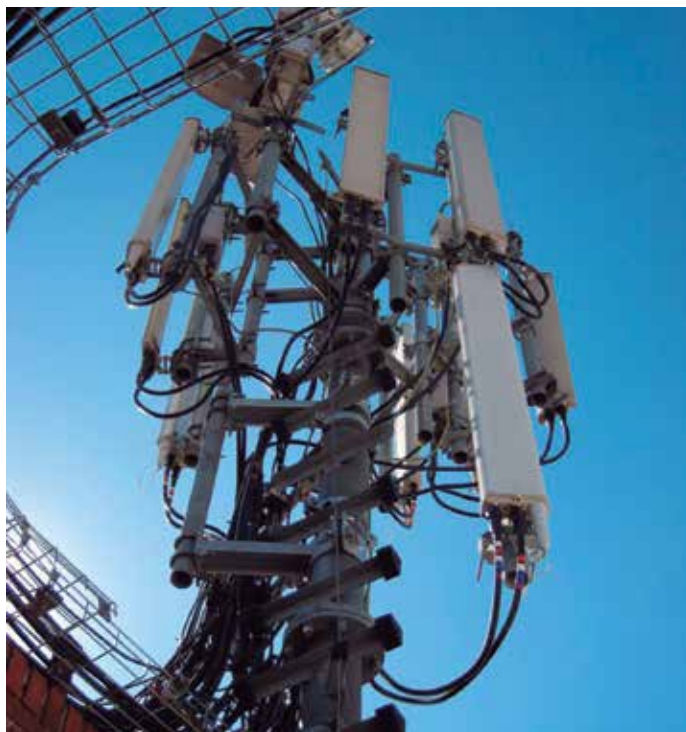
El Informe del SATI analiza las consecuencias de la normativa en las infraestructuras de estas características.

A este respecto, es preciso destacar que el Modelo de Ordenanza Municipal de la FEMP se ve afectado en los artículos que se refieren al régimen jurídico de las licencias, a saber, los artículos 18, 19 y 20. De ellos, únicamente el artículo 18 debería incorporar un nuevo párrafo, previendo las excepciones a la exigencia de licencia. Asimismo, la Disposición Transitoria Primera debería ser revisada en su apartado 1.2 para contemplar la regularización mediante la presentación de la declaración responsable o la comunicación previa.