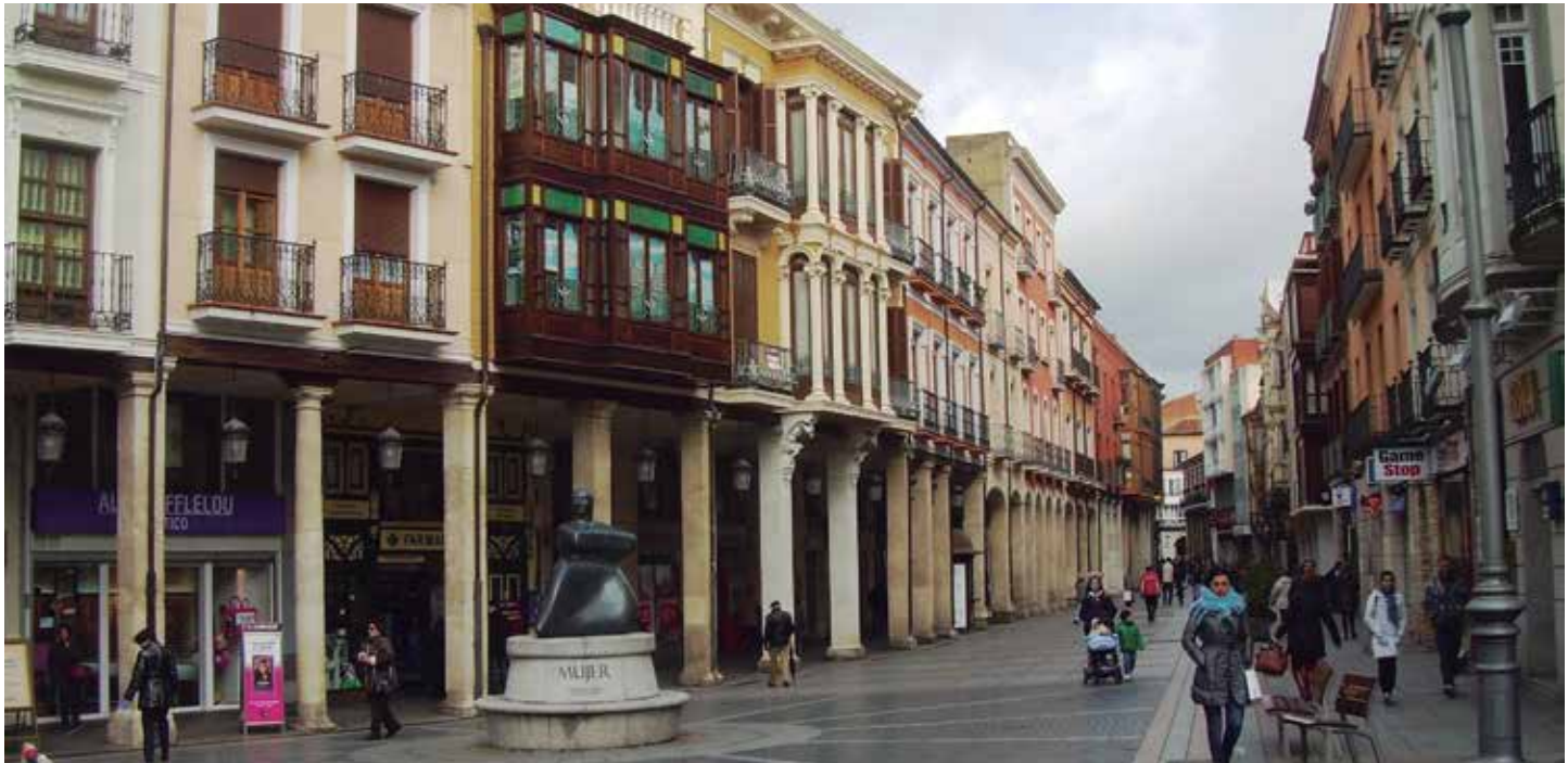
El Plan del Gobierno contempla ayudas para la mejora de centros urbanos y cascos históricos.

Garantizar el derecho a un hogar digno y adecuado a las personas más necesitadas, mejorar las condiciones de habitabilidad y sostenibilidad del parque de viviendas y tratar de reactivar el sector de la construcción, son los tres objetivos básicos del conjunto de medidas que el Gobierno piensa poner en marcha inmediatamente para acometer un cambio de modelo en la política de vivienda y suelo, que afecta a los municipios y en el que los Ayuntamientos también tienen mucho que aportar.