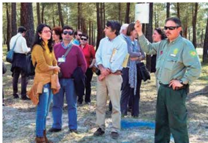
Pie: Participantes en el simposio.

Además pusieron de manifiesto la necesidad de integrar las tareas de resinación con las labores de selvicultura preventiva y de extinción de incendios forestales, y que su financiación se enmarque en los programas de desarrollo