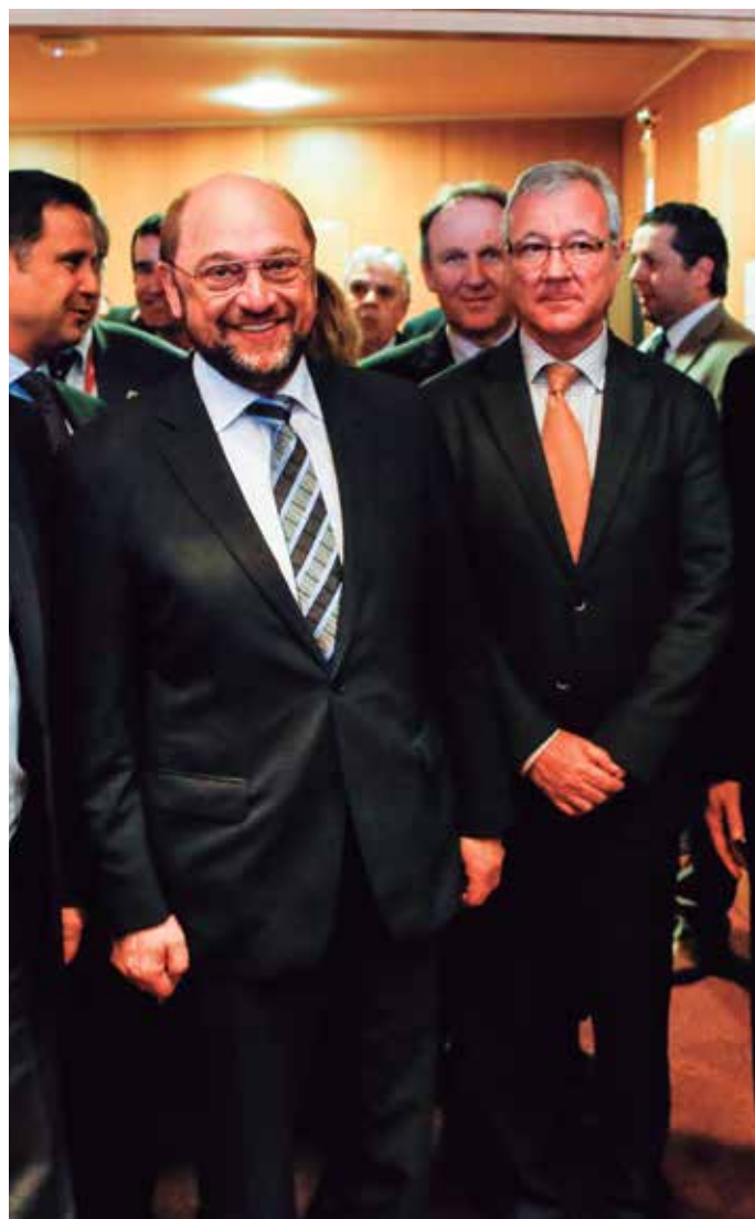
El Presidente del Parlamento Europeo, Martin Schulz, y el Presidente del Comité de las Regiones, Ramón Luis Valcárcel.

La víspera del Pleno se celebró una conferencia sobre política industrial dentro del ciclo que el CDR está organizando para analizar una por una las siete iniciativas emblemáticas de Europa 2020 desde una perspectiva regional y local. En ella el Presidente, Ramón Luis Valcárcel, respaldó los planes de la Comisión para una nueva política industrial europea, pero advirtió de que ignorar la dimensión territorial podría limitar su incidencia, ya que, "las ciudades y regiones de Europa, si cuentan con los instrumentos adecuados, pueden convertirse en elementos clave de la recuperación y reactivación de nuestra industria" .