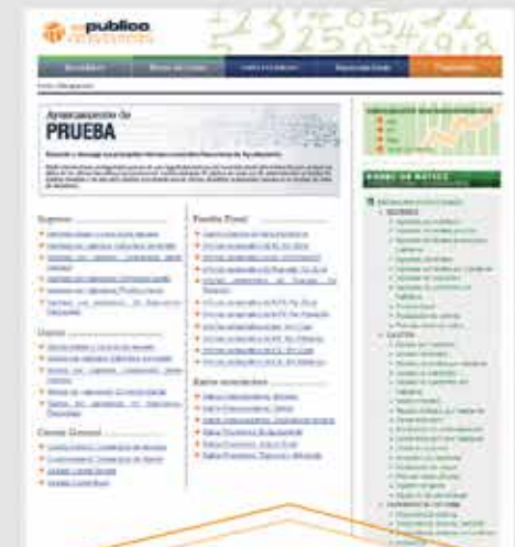
Mis estudios Informes económicos de tu Ayuntamiento Indicadores macroeconómicos Panel de ratios estatales

Además con el SERVICIO DE ASISTENCIA , el usuario podrá acceder a guías didácticas para la realización de cualquier informe y contar con el apoyo de un gestor que le resuelva dudas, aclare cuestiones concretas, supervise sus informes o se encargue de su ejecución.