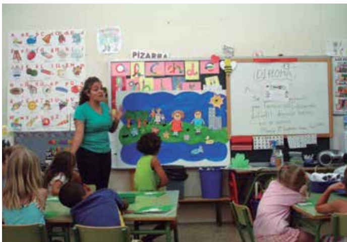
En materia de educación, la FEMP pide que el traspaso de la competencia a su titular –la Comunidad Autónoma- incluya sólo los medios personales y materiales, pero no los financieros.

que los municipios realicen actividades complementarias de las propias de otras Administraciones Públicas, ya contemplada en el artículo 28 de la Ley de Bases.